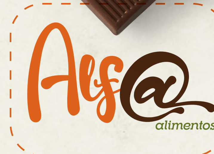
Texto Abaixo do Logo