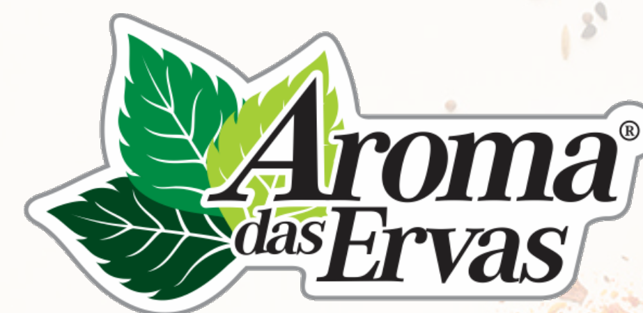
Aroma das Ervas