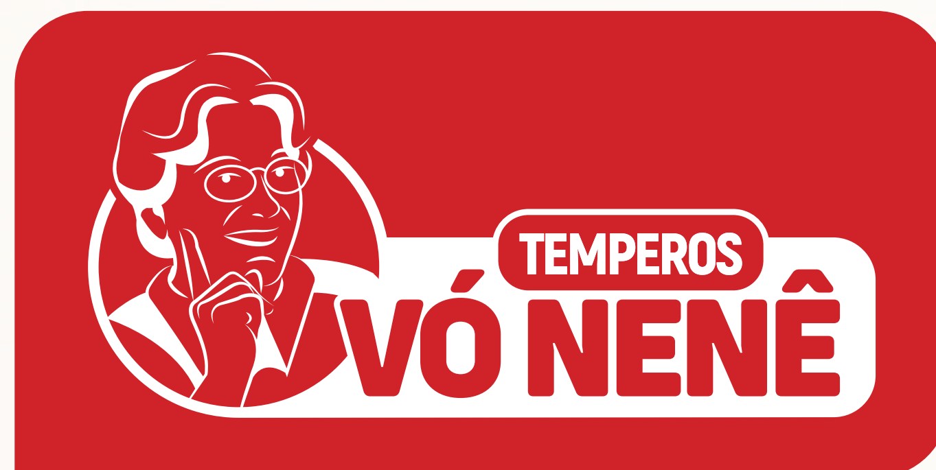
Negativo Fundo Vermelho