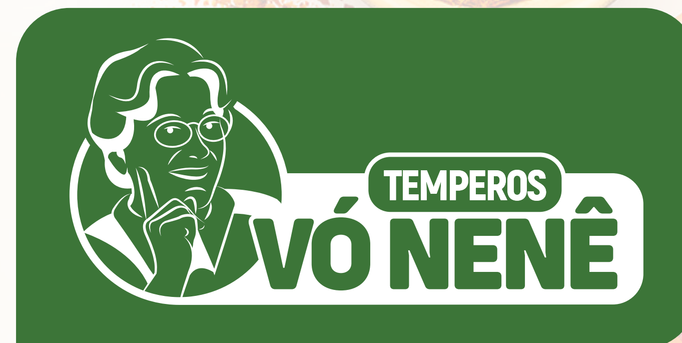
Negativo Fundo Verde